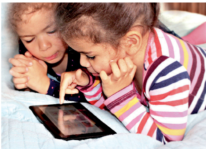
Abb. 1 LED-Bildschirme enthalten einen höheren Blaulichtanteil als Tageslicht

Es ist gar nicht so einfach, die Ursache-Wirkungsbeziehungen zwischen dem Betrachten eines LED-Bildschirms und der geminderten Schlafqualität in der Nacht und Wachheit am anderen Tag aufzuklären. Liegt das nicht eher an der Aufregung durch die Inhalte? – könnte man mit Fug und Recht argumentieren. Um hier weiter