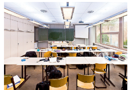
Abb. 3 Normale (oben) und im Blauanteil verstärkte (unten) Beleuchtung im Klassenzimmer (Originalsetting der Studie).